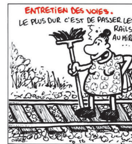
LE RAIL • N°28 • AOUT 1991 - 3