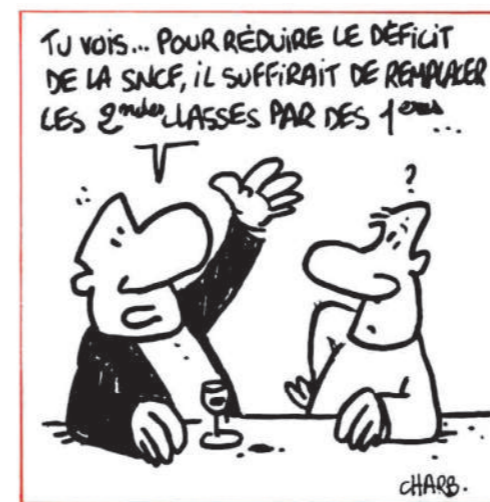
LE RAIL • N°33 • JUILLET 1992 - 3