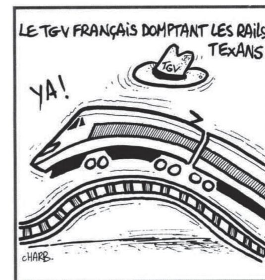
LE RAIL • N°27 • JUIN 1991 - 3

Френското TGV обязгва тексаските релси. Ya!