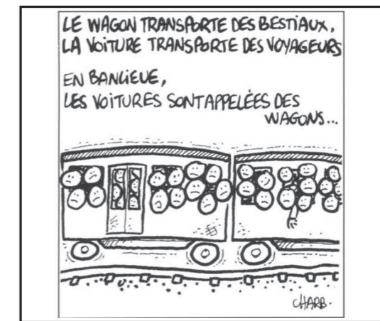
LE RAIL • HS 2 • DÉCEMBRE 1991 - 3