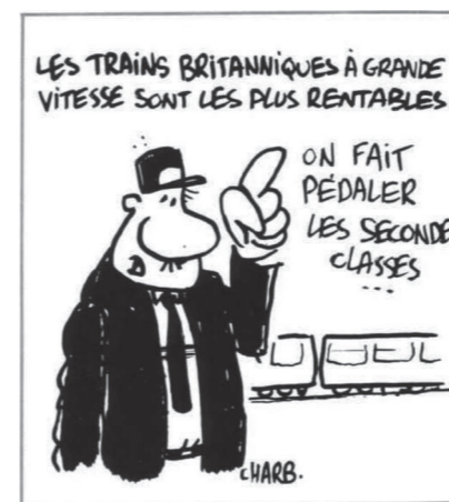
LE RAIL • N°26 • AVRIL 1991 - 3

Френското TGV обязгва тексаските релси. Ya!